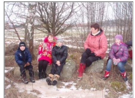
Ketvirtoji grupė.