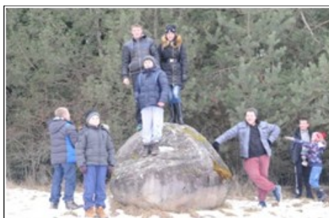
Trečioji grupė.

po Sauginių kaimą. Ekskursijos gidai buvo 8 klasės mokiniai, gyvenantys Sauginiuose: Greta, Evaldas ir Rokas. Jų dėka visi sužinojo, koks gilus istorinis pėdsakas gaubia Sauginių kaimą. Aplankė paminklą šauliams ir paminklą J. Juozapaičiui, senąjį pilikalnį, Šiaulių jūros varkariniame krante stūksančią Velnio kuprą, išsiaiškino Švendrės botaninio draustinio