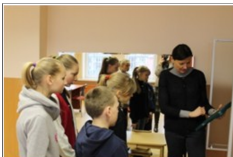
Šeštoji grupė.

Šeštoji grupė vyko į Šiaulius. Aplankė respublikinę mokinių fotografijų parodą „Aš tikrai myliu Lietu-