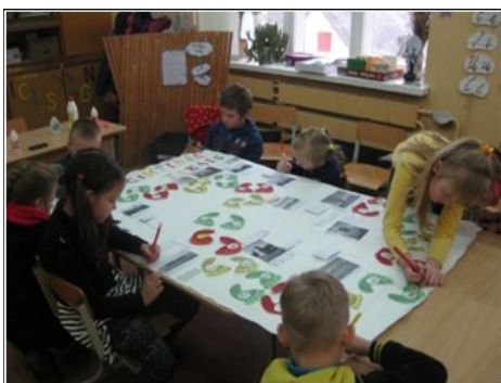
Penktoji grupė.

va...“ ( Gytarių progimnazijoje ). Parodoje dalyvavo ir Aukštelkės mokyklos mokiniai. Dar apsilankė Šiaulių universiteto Socialinės gerovės ir negalės studijų fakulteto Logopedijos centre, kuriame doc. L. Miltenienė parodė priemones, žaidimus, skirtus kalbos ugdymui. Pabu-