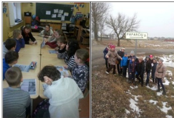
Antroji grupė.