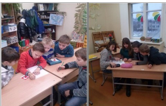
Pirmoji grupė .

Pirmoji grupė kūrė video albumą "Pailių ir Raizgių kraštovaizdžio unikalumas". Mokiniai, besidomintys Pailių ir Raizgių krašto istorija, geografija, nusprendė juos patyrinėti. Susirinkę pasidalijo turimomis žiniomis ir iš anksto iš įvairių informacijos šaltinių surinkta informacija. Aptarė, kas sieja šiuos du kaimus, pasiskirstė vaidmenimis ir, pasiėmę kompasą bei filmavimo kamerą, išsiruošė ekspedicijon. Sukurtą video albumą galima pažiūrėti https://www.facebook.com/video.php?v=424267957732477&set=o.710954095649694&type=2&theater